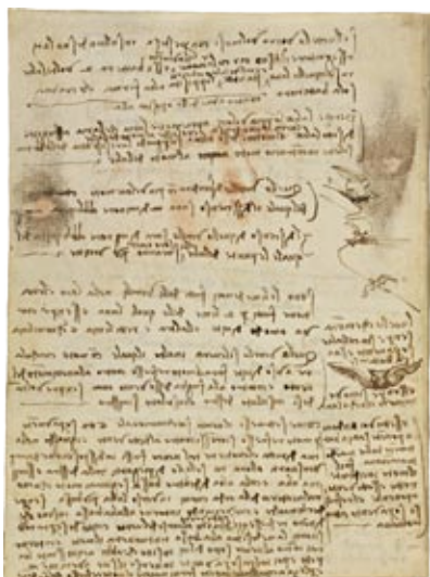
Da sinistra a destra: la pagina originale del Codice del Volo, il ritratto restaurato digitalmente da Leonardo3 nel 2007 e il celebre Autoritratto