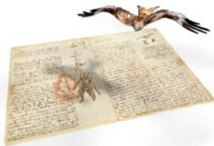
Il Codice del Volo è un titolo Leonardo3 pubblicato nell'ottobre del 2007 (© L3)