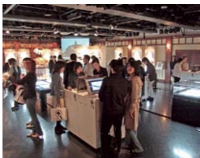
La mostra di Tokyo