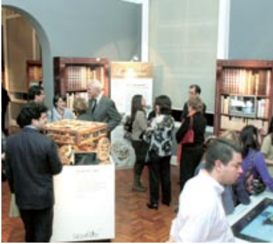
"Os Segredos Dos Codigos de Leonardo da Vinci" al Museu da Casa Brasileira di San Paolo