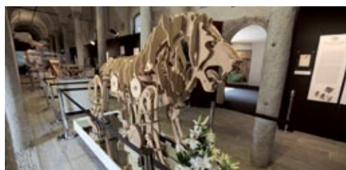
La mostra "Il Laboratorio di Leonardo" nel Castello di Vigevano

USA e Canada: la mostra "Da Vinci's Workshop" vedrà due tappe nel 2011, la prima delle quali a Filadelfia.