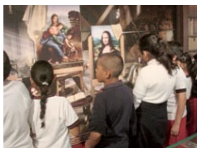
La mostra in Messico al Papalote Museo del Nino