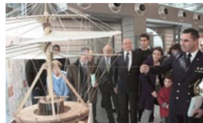
"Leonardo e il Volo" al Museo di Storia Naturale del Mediterraneo di Livorno

Contatto per la stampa: Massimiliano Lisa lisa@leonardo3.net Tel. 02 79.41.81 Per ulteriori informazioni: www.leonardo3.net