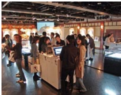
La mostra di Tokyo