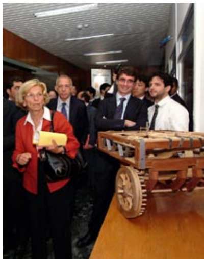
Il congresso all'ICE di Roma