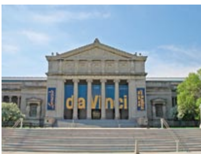
Il Museum of Science and Industry di Chicago