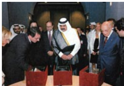
L'inaugurazione della mostra in Qatar con l'Emiro e il Presidente della Repubblica italiana Giorgio Napolitano