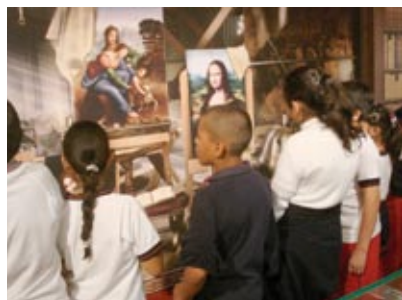
La mostra in Messico al Papalote Museo del Nino