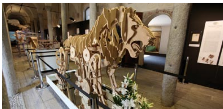
Il Laboratorio di Leonardo nella Città Ideale nel Castello di Vigevano