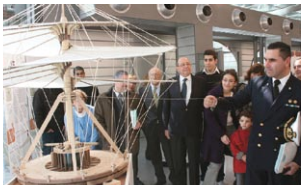
"Leonardo e il Volo" al Museo di Storia Naturale del Mediterraneo di Livorno

postazioni interattive fino ad arrivare a un avveniristico megaschermo touch-screen olografico. L'inaugurazione avviene alla presenza dell'Emiro del Qatar e di dignitari da tutto il mondo; il lavoro di L3 rappresenta l'unica presenza di ricostruzioni realizzate oggi e di tecnologia moderna in mezzo agli oltre 800 pezzi antichi esposti nel museo.