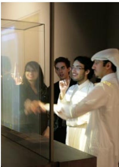
Lo schermo olografico touch-screen utilizzato per Il Libro dei Segreti