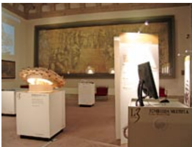
La mostra L3 nella Sala del Cartone di Raffaello dell'Ambrosiana