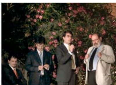
Umberto Eco premia Leonardo3

Milano: esce in libreria il nuovo e attesissimo volume "I Robot di Leonardo", oltre 450 pagine, frutto di un lavoro lungo e complesso, illustrate con inedite immagini 3D che gettano nuova luce su progetti come il Leone Meccanico, il Cavaliere-Robot e l'Automobile. Il titolo ottiene copertura mediatica sul TG3, il Corriere della Sera , FOCUS ... L'esperto Leonardiano Carlo Pedretti scrive: "I Robot di Leonardo, un'ampia e ricca rassegna che si presenta come la realizzazione virtuale di un grandioso museo degli aspetti più innovativi della tecnologia vinciana".