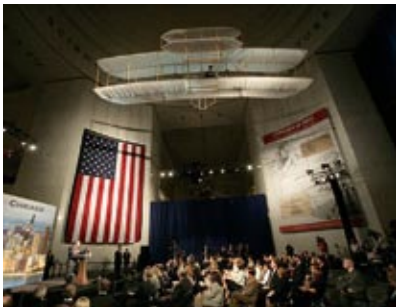
Conferenza stampa del Presidente degli Stati Uniti davanti all'ingresso della mostra L3 a Chicago