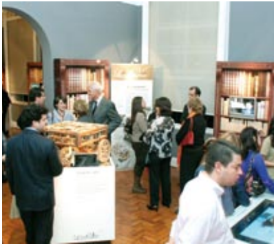
"Os Segredos Dos Codigos de Leonardo da Vinci" al Museu da Casa Brasileira di San Paolo