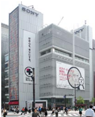
La mostra di Leonardo3 al Sony Building, nel centro di Tokyo