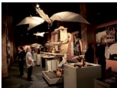
La mostra "Da Vinci's Workshop" presso il Discovery Exposition Center di Times Square a New York

New York, USA: si apre la mostra " Da Vinci's Workshop " di Leonardo3 presso il Discovery Exposition Center di Times Square (21 novembre 2009 - 14 marzo 2010). La mostra totalizza oltre 80 mila visitatori e il suo successo la fa diventare una mostra itinerante di successo nel Nordamerica.