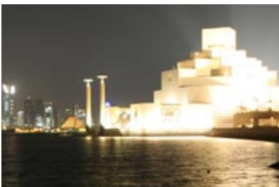
Il Museo di Arte Islamica di Doha è stato inaugurato il 22 novembre 2008 alla presenza di dignitari da tutto il mondo