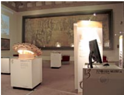
La mostra L3 nella Sala del Cartone di Raffaello dell'Ambrosiana