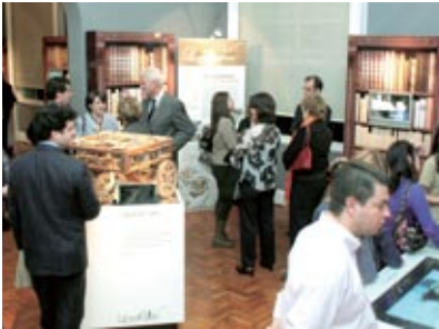
"Os Segredos Dos Codigos de Leonardo da Vinci" al Museu da Casa Brasileira di San Paolo