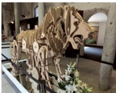
La mostra "Il Laboratorio di Leonardo" nel Castello di Vigevano

Livorno: la mostra " Leonardo e il Volo " di Leonardo3 viene inaugurata al Museo di Storia Naturale del Mediterraneo , in collaborazione con la Provincia di Livorno (4 aprile-4 luglio 2009).