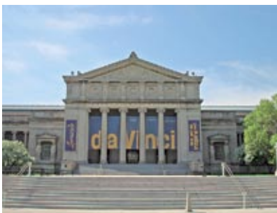
Il Museum of Science and Industry di Chicago