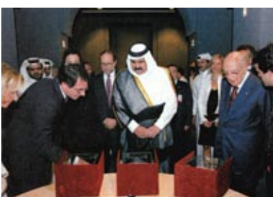
L'inaugurazione della mostra in Qatar con l'Emiro e il Presidente della Repubblica italiana Giorgio Napolitano