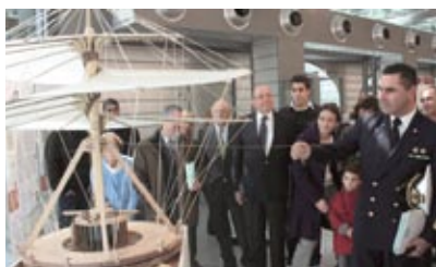
"Leonardo e il Volo" al Museo di Storia Naturale del Mediterraneo di Livorno

postazioni interattive fino ad arrivare a un avveniristico megaschermo touch-screen olografico. L'inaugurazione avviene alla presenza dell'Emiro del Qatar e di dignitari da tutto il mondo; il lavoro di L3 rappresenta l'unica presenza di ricostruzioni realizzate oggi e di tecnologia moderna in mezzo agli oltre 800 pezzi antichi esposti nel museo.