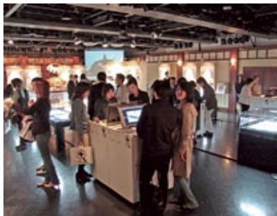
La mostra di Tokyo