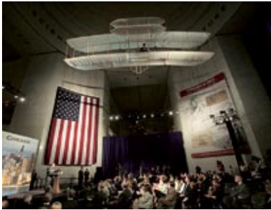
Conferenza stampa del Presidente degli Stati Uniti davanti all'ingresso della mostra L3 a Chicago