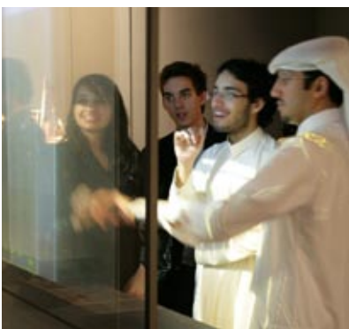
Lo schermo olografico touch-screen utilizzato per Il Libro dei Segreti