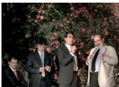
Umberto Eco premia Leonardo3

Milano: esce in libreria il nuovo e attesissimo volume "I Robot di Leonardo", oltre 450 pagine, frutto di un lavoro lungo e complesso, illustrate con inedite immagini 3D che gettano nuova luce su progetti come il Leone Meccanico, il Cavaliere-Robot e l'Automobile. Il titolo ottiene copertura mediatica sul TG3, il Corriere della Sera , FOCUS ... L'esperto Leonardiano Carlo Pedretti scrive: "I Robot di Leonardo, un'ampia e ricca rassegna che si presenta come la realizzazione virtuale di un grandioso museo degli aspetti più innovativi della tecnologia vinciana".