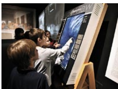
La mostra "Da Vinci's Workshop" al Franklin Institute di Filadelfia

Canada: la mostra " Da Vinci's Workshop " si apre all'Ontario Science Center di Toronto, in Canada, il 13 ottobre.