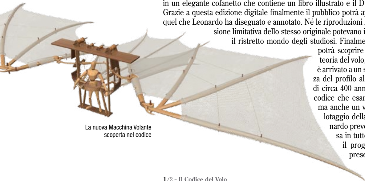
La nuova Macchina Volante scoperta nel codice

potrà scoprire che Leonardo ha studiato la teoria del volo, ha descritto leggi corrette ed è arrivato a un soffio dal postulare l'importanza del profilo alare, anticipando gli aeroplani di circa 400 anni. In larga parte questo è un codice che esamina come volano gli uccelli, ma anche un vero e proprio "manuale di pilotaggio della Macchina Volante" che Leonardo prevedeva sarebbe diventata famosa in tutto il mondo. Per la prima volta il progetto della Macchina Volante presente in questo codice è stato