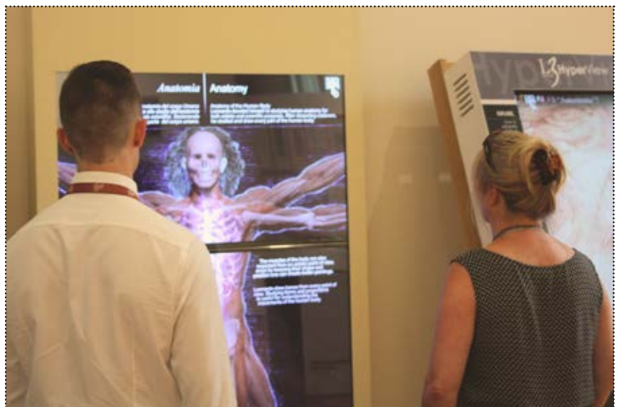
L'installazione multimediale dedicata all'Uomo Vitruviano