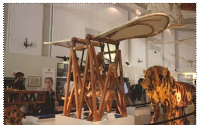
Le Ali battenti